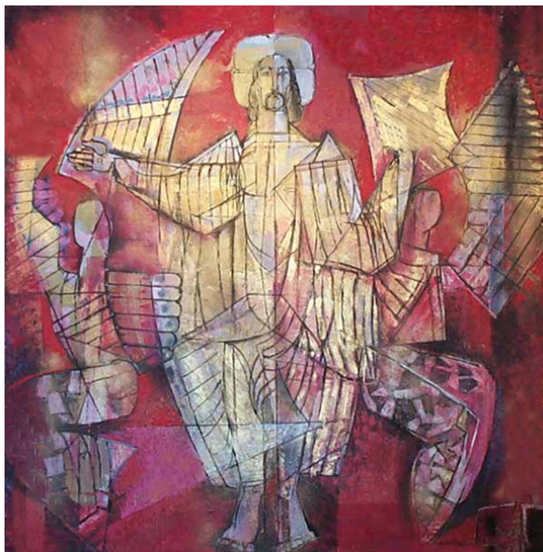
Herz-Jesu. Tryptichon, Kapelle der Schwestern vom Augustinuswerk. Gemälde von André Brechet

Diese beiden Bilder sind nicht identisch. Beim Bild rechts haben sich insgesamt sieben Fehler eingeschlichen. Schauen Sie genau hin und überlegen Sie, was sich im Vergleich zum linken Bild geändert hat.