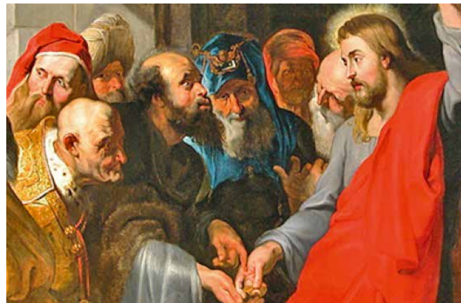
Darstellung der biblischen Szene, jene mit der berühmten Episode der Steuer, die Cäsar geschuldet ist.

Gegner Jesus scheinheilig vor die Füsse werfen. Wenn die Silbermünze das Bildnis des Kaisers zeigt und ihm daher zurückgegeben werden muss, was ist dann mit dem Bildnis Gottes, das ihm zurückgege-