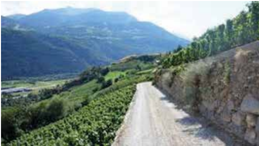
Kulturweg durch die Rebberge mit Blick aufs Rhonetal

Von Raron führt ein Kulturweg nach St. German, das zur Gemeinde Raron gehört und inmitten von Rebbergen liegt, welche die Römer als Erbe hinterlassen haben.