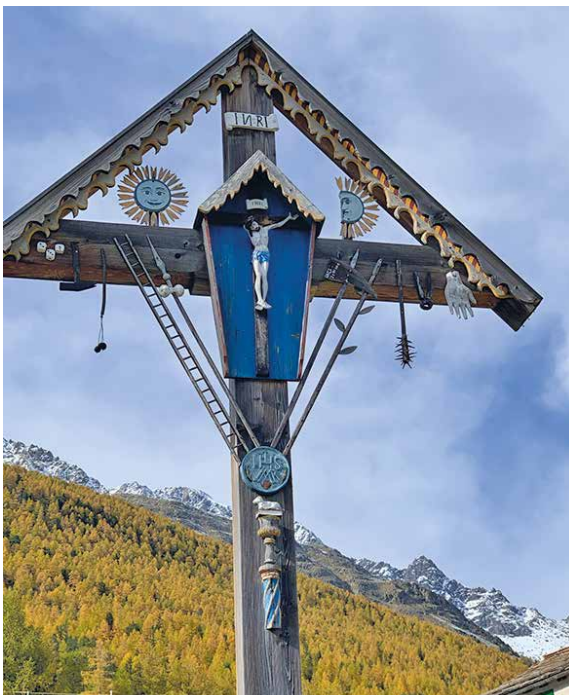
Foto: Wegkreuz in Saas Fee