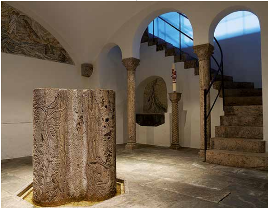
Taufkapelle, Abtei St-Maurice