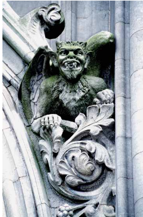
Der Teufel, Detail der Fassade der Kathedrale von Saint-Colman.