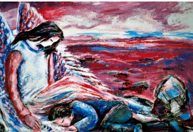
Illustration: Sr Isabel Bachmann