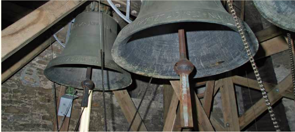
Glocken von Saas Grund

Die Abendmahlsmesse am Gründonnerstag ragt durch einige besondere Handlungen aus den «normalen» Messen im Laufe des Jahres hervor. So läuten etwa während des Glorias unter lautem Orgelklang alle Kirchenglocken und sogar die Altarglocken der Messdiener. Drei Tage schweigen die Glocken danach aus Trauer über das Leiden und Sterben Jesu. Die Tradition sagt, dass die Kirchenglocken nach Rom fliegen, bis sie dann am Karfreitag zurückkehren und durch ihr volles Geläute die Auferstehung Jesu verkünden. Sie werden dadurch zu Boten der Frohen Botschaft: «Christus ist auferstanden! Er ist wahrhaft auferstanden!»