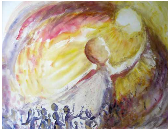
Bild von Caroline Cousin «Huld und Treue begegnen einander; Gerechtigkeit und Friede umarmen sich»

Worin wird die Rettung bestehen, die er schenken wird? Sie baut auf vier untrennbaren Säulen auf: «Huld und Treue begegnen einander; Gerechtigkeit und Friede küssen sich» (V.11). Diese Attribute Gottes sind wie Personen dargestellt, sie